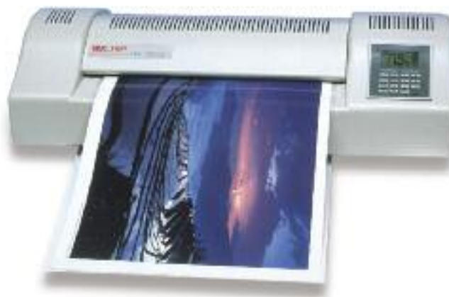
Machine HeatSeal™ 3500LM